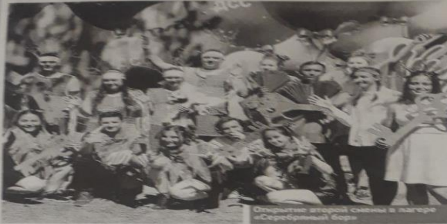
Открытие второй смены в лагере «Серебряный бор»