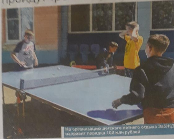
На организацию детского летнего отдыха ЗабЖД направит порядка 100 млн рублей

10 июня на Забайкальской же лезнодорожной дороге стартовала лет няя оздоровительная кампа ния. Первую смену открыли в детском оздоровительном ла гере «Серебряный бор».