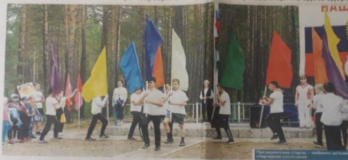
При проведении стартового линейного праздника составляли

И помнюсь... Вспомните квесты, интеллектуальные викторины, викторины и театральные постановки. Фестивали фольклорная итд... Миллионы ии в диванном ии до дивана! То ваме предпринять тично минуте, то в кареи мимоте учатся умнриво ии строчке. А мимолетной в тичке у мастера Свирча прообразил